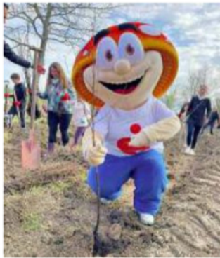
Die Stadtsparkasse Dessau hatte zur Baumpflanzaktion in der Nähe des Leiner Bergs eingeladen.

Der Startschuss für die Aktion im Dessau-Wörlitzer Gartenreich fiel am Sonnabendvormittag mit dem symbolischen Setzen eines Pflanzschildes und dem ersten Spatenstich. „Viele Hände – schnelles Ende“: das stellten dann mehr als 120 Dessau-Roßlauer bei schönstem Sonnenschein und getragen von einem großen Gemein-